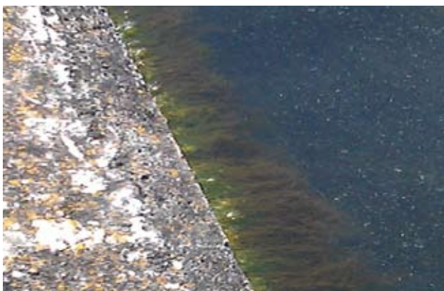
Vasca senza Happy Fish