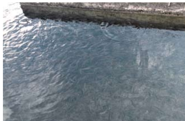
Vasca con Happy Fish

Negli stagni e laghetti i nostri prodotti sono in grado di ostacolare la marcescenza causata dal depositarsi di diversi materiali organici sul fondo, come foglie, alghe, polline di piante, semi, mangime per i pesci ecc. trasformandola a nostro vantaggio. In questo modo lo stagno si nutre in modo ottimale garantendo una crescita controllata delle piante acquatiche e, soprattutto, del fitoplancton .